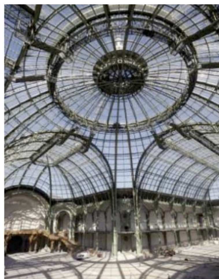
Le Grand Palais - Paris