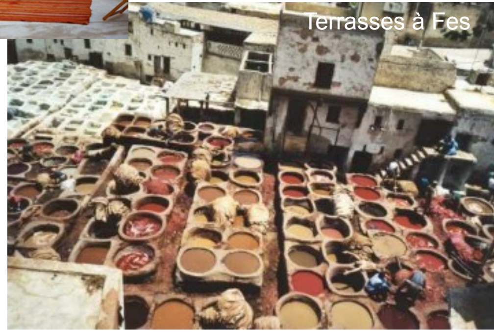
Terrasses à Fes