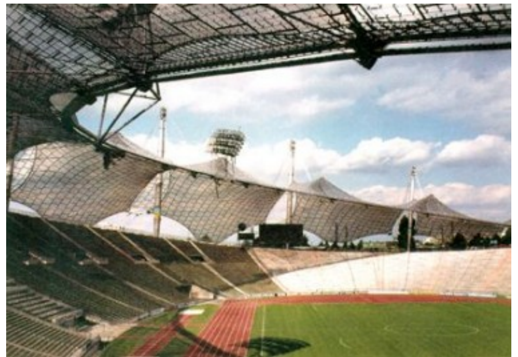
toit du Stade Olympique de Munich