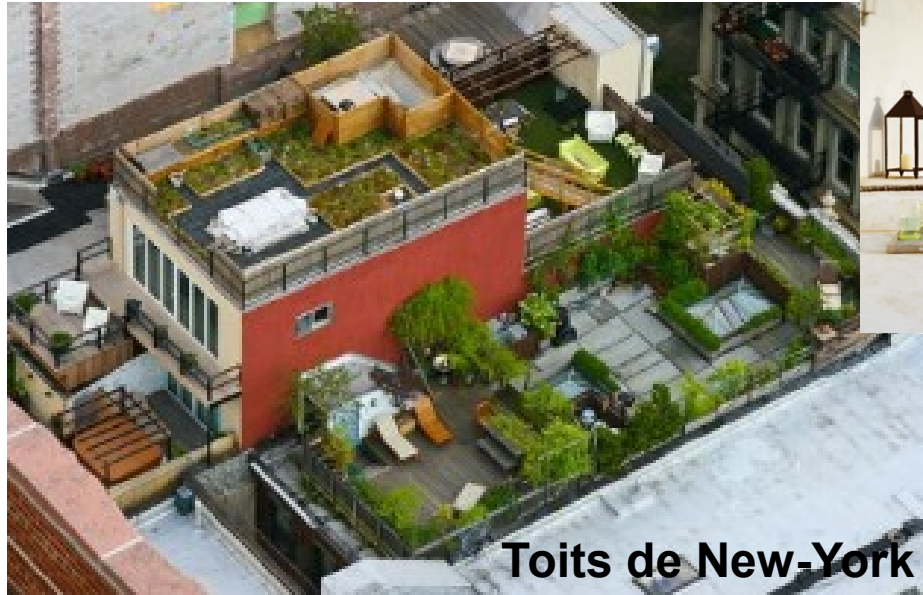
Toits de New-York