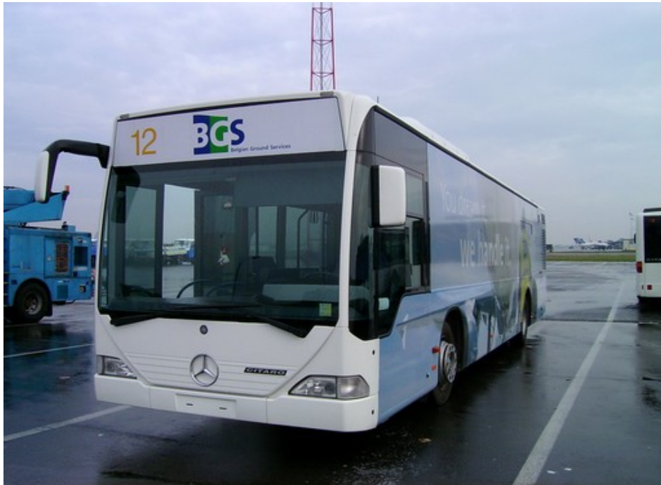
Pare-brise d'un car