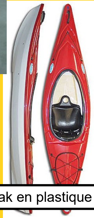
Kayak en plastique

En fonction des origines des matériaux (définis à la page précédente) colorier :