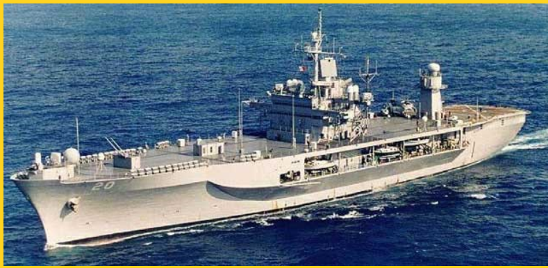
Coque en acier