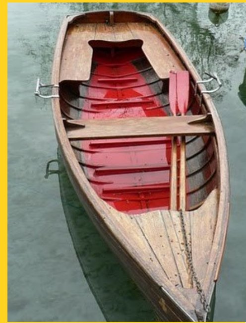
Barque en bois