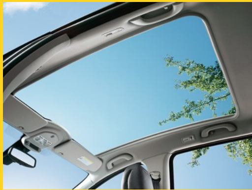
Vitre et toit en verre