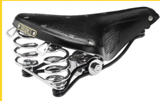
Selle en cuir