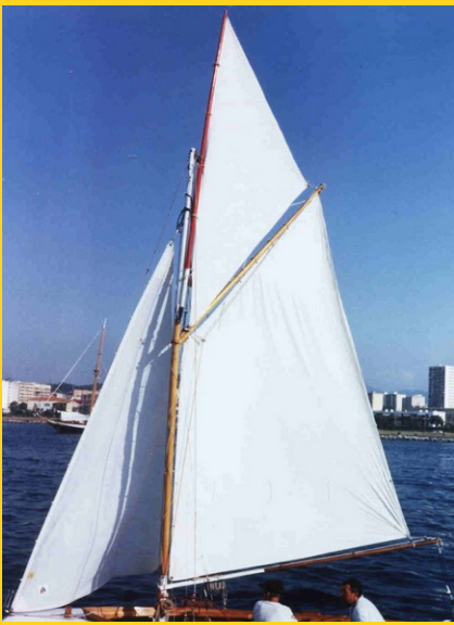
Voiles en coton